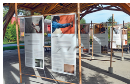
Exposition Terre de Bâti-seuses