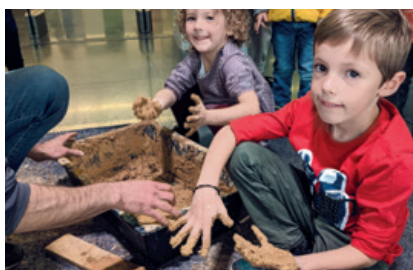
Découverte des métiers du bâtiment durable avec Batylab et CMQ Bâtiment Durable Bretagne