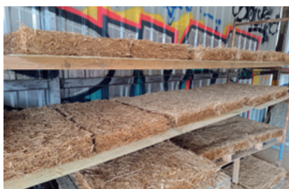
Animations et démos autour des matériaux biosourcés avec [FB]²