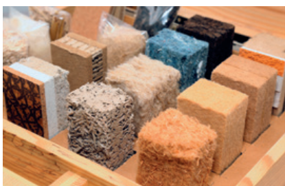
Stand conseil, causeries et quiz sur la rénovation avec l'ALEC de Rennes et Tiez Breiz