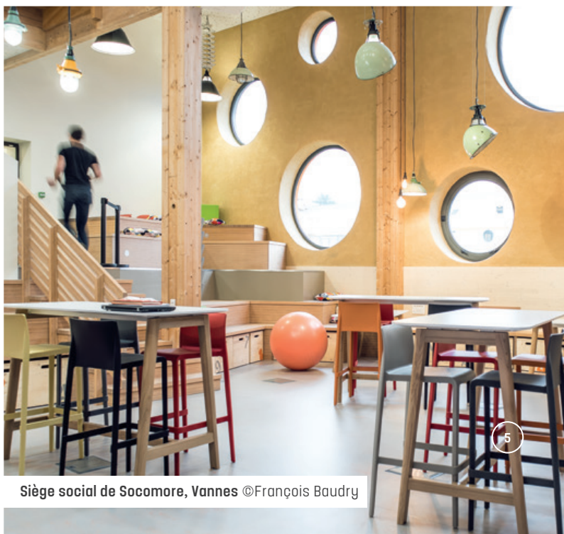
Siège social de Socomore, Vannes