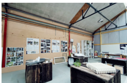
Ouverture du dépôt-vente de Bâti Récup