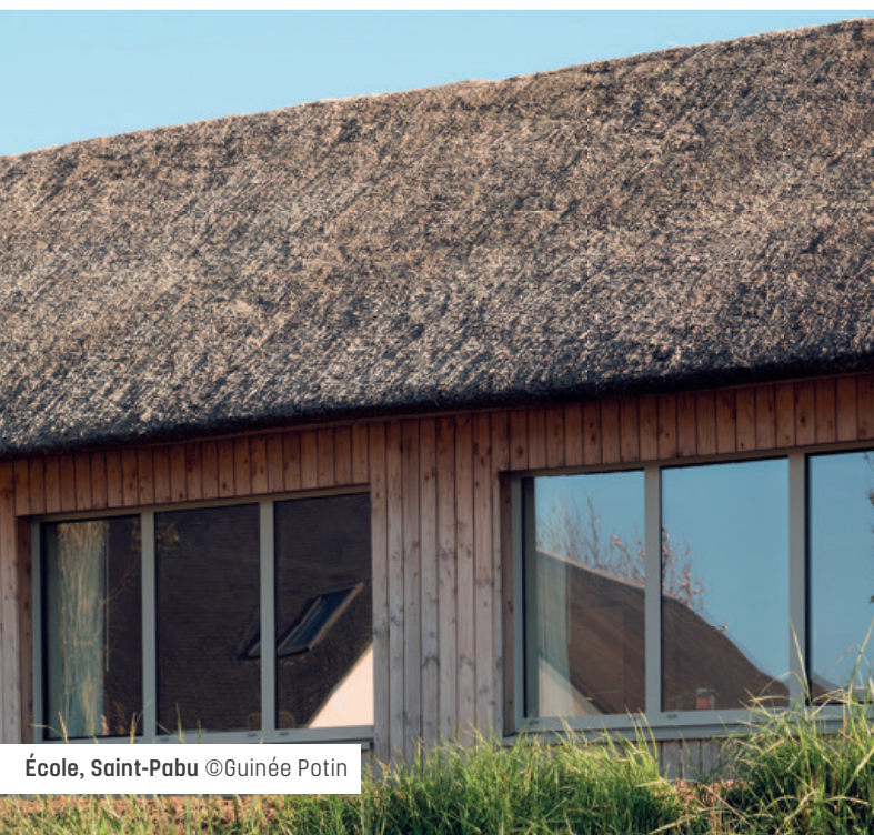
École, Saint-Pabu