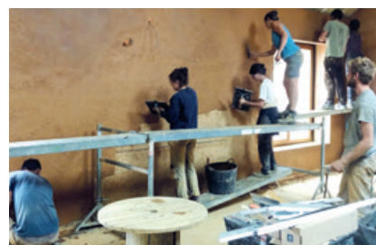
Participation à un vrai chantier avec Empreinte