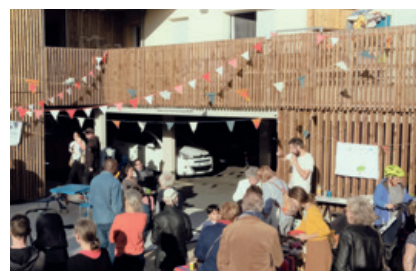
Stand d'information sur l'habitat participatif avec Parasol 35