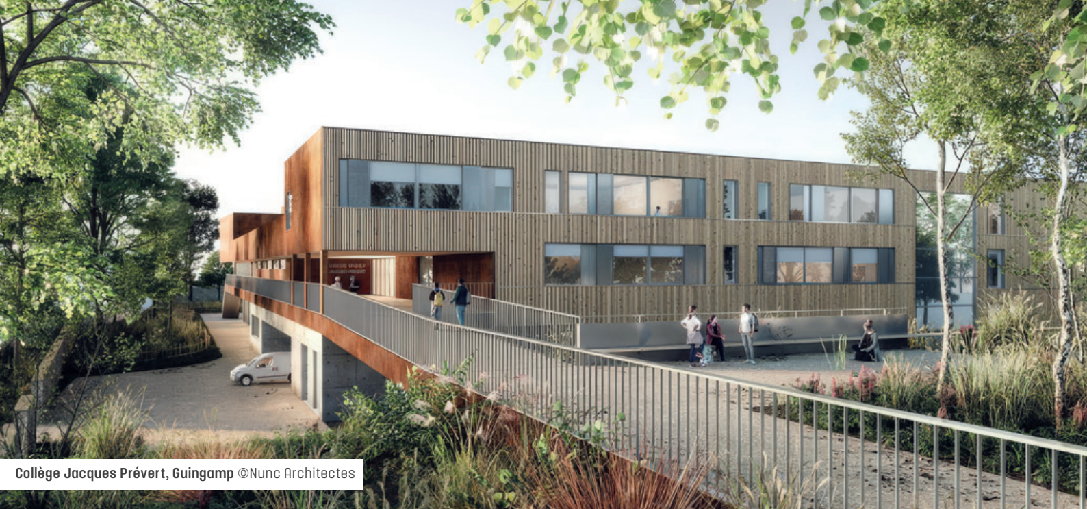
Collège Jacques Prévert, Guingamp ©Nunc Architectes