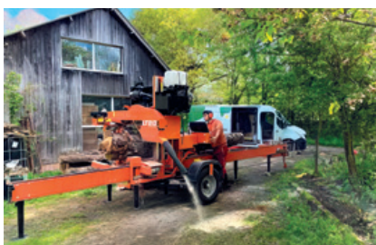
Animation scierie mobile et ateliers bois avec Fibois Bretagne et les Animé.e.s