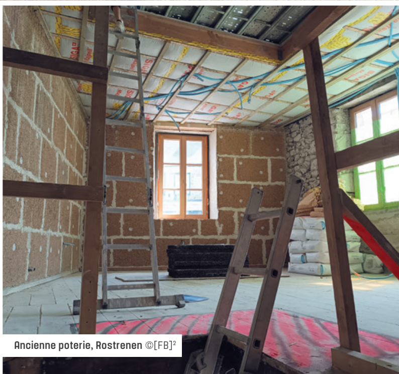
Ancienne poterie, Rostrenen